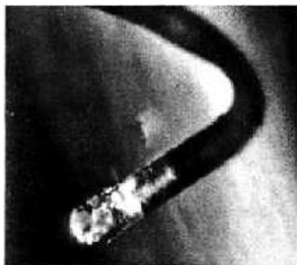
Obr. 13: Hlavička vlákna Morgellona.