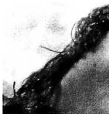
Obr. 14: Sít' nanovláken.